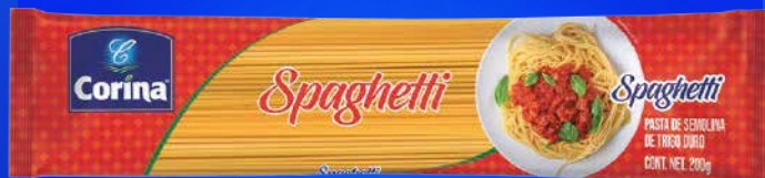
Pasta de Semolina de Trigo Spaguetti/ Wheat Semolina Pasta Spaguetti