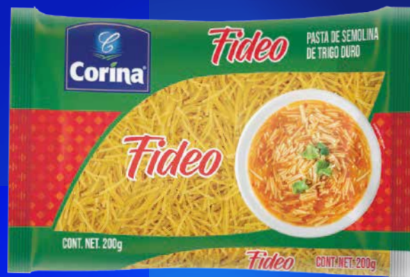
Pasta de Semolina de Trigo Fideo/ Wheat Semolina Pasta Noodles