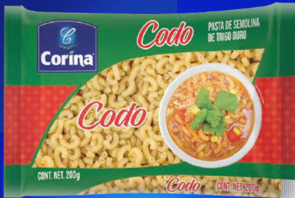
Pasta de Semolina de Trigo Codo/ Wheat Semolina Pasta Elbow